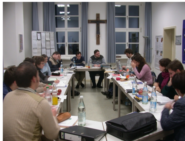
Tagung der AGT 2004 in Niddatal bei Frankfurt/Main

Die Arbeitsgemeinschaft Studierende der Katholischen Theologie in Deutschland (AGT) ist 1969 als Zusammenschluss von Mentoraten und Fachschaften der katholisch-theologischen Fakultäten in Deutschland gegründet worden. Ihre Aufgabe lässt sich mit den vier Schlagworten Vernetzung, Information, Koordination und Interessenvertretung umschreiben. Brisante hochschul- und kirchenpolitische Themen werden von der AGT aufgegriffen und bearbeitet. Die Ergebnisse ihrer Arbeit veröffentlicht die AGT etwa auf dem Katholisch-Theologischen Fakultätentag und gegenüber der Deutschen Bischofskonferenz. Weitere Informationen erhalten Sie unter www.bundesfachschaft-theologie.de .